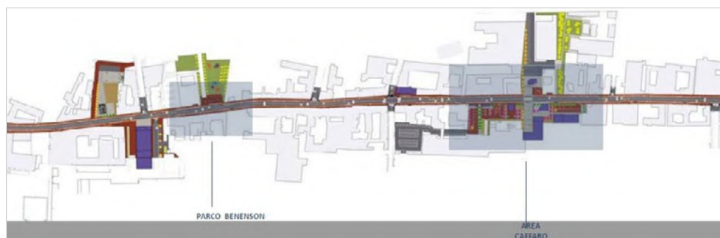
Fig.2. Planimetria generale degli interventi lungo via Milano.