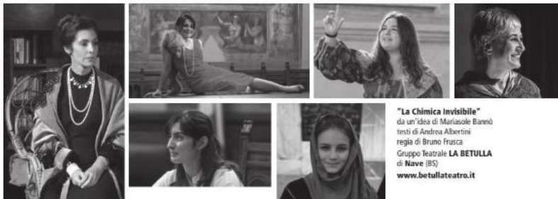
"La Chimica Invisibile" da un'idea di Mariasole Bannò testi di Andrea Albertini regia di Bruno Frusca Gruppo Teatrale LA BETULLA di Nave (BS) www.bettullateatro.it

Nell'ambito della rassegna digitale PORTIAMO IL TEATRO A CASA TUA, ideata e creata da Mariagrazia Innecco – MILANO