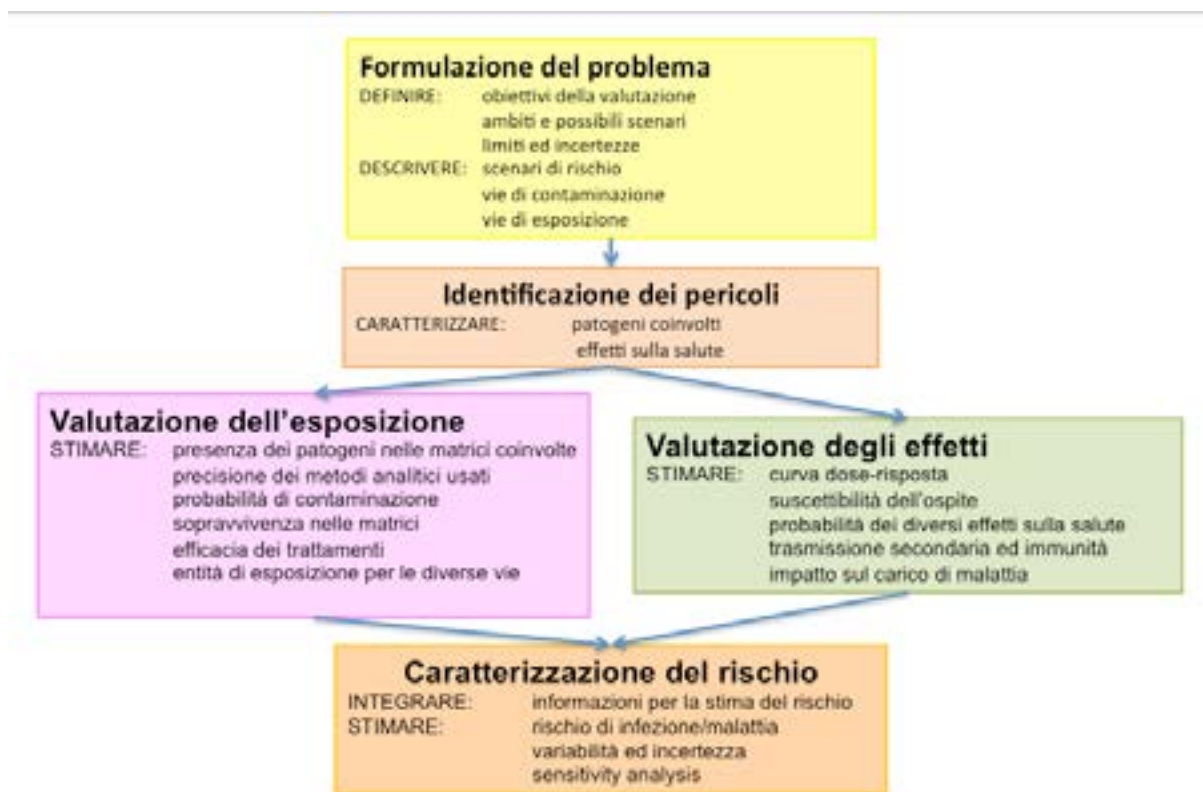
Figura 1: Schema concettuale della QMRA

Formulazione del problema. Rappresenta il primo passo necessario a stabilire con chiarezza l'ambito e lo scopo della valutazione. In questa fase debbono essere formulati i quesiti specifici e definito il livello di accuratezza delle stime appropriato alla gestione del rischio, debbono essere identificati i pericoli, le vie di contaminazione e tutti possibili scenari di esposizione e di effetti sulla salute.