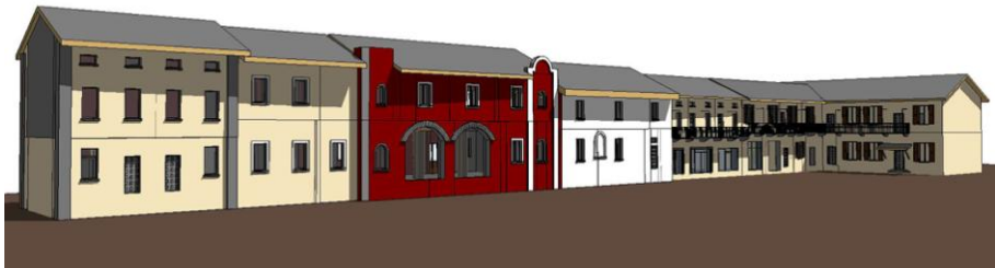
Fig. 3 - Modello dello stato di fatto.