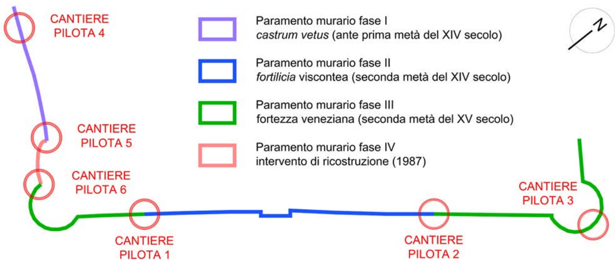
Fig. 3. Schema planimetrico dell'area oggetto d'intervento con l'indicazione delle fasi costruttive e la localizzazione dei cantieri pilota (S. Barbò 2022).

zone considerate maggiormente rappresentative delle caratteristiche materiche e conservative del paramento (Fig. 3). Ciascuno di essi ha interessato una fascia di larghezza compresa tra i quattro e i cinque metri per un'altezza variabile fino a un massimo di circa undici metri (altezza delle mura). Le aree sono state individuate preferibilmente all'interfaccia fra due paramenti appartenenti a fasi costruttive diverse, permettendo di valutare contestualmente l'efficacia di uno stesso intervento su supporti con caratteristiche non omogenee (Fig. 4).