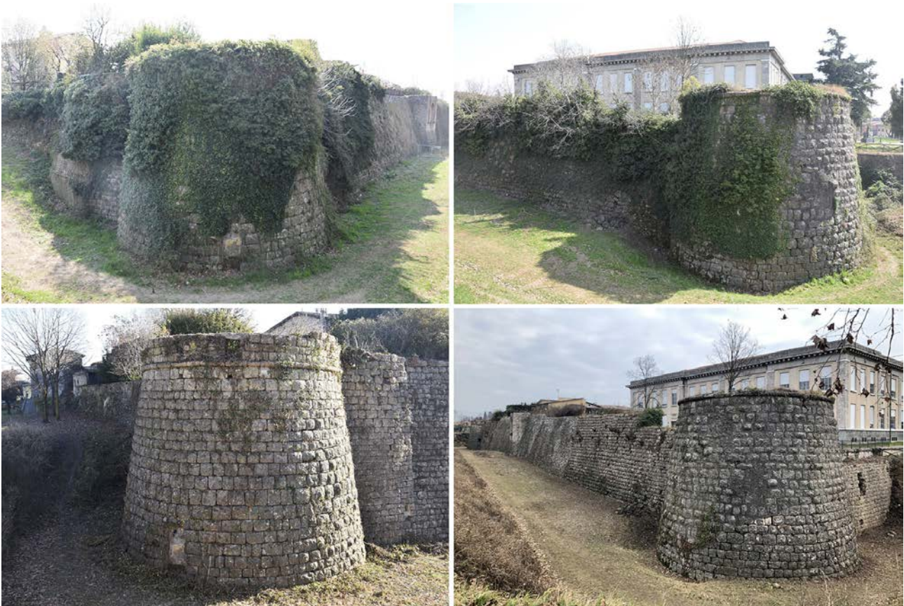
Fig. 2. Particolare delle cortine murarie prima (febbraio 2021) e dopo l'avvio dei cicli di rimozione della vegetazione infestante (febbraio 2022). A sinistra: viste del torrione nord-ovest (canton Pusterla). A destra: viste del torrione sud-ovest (canton Cattaneo) e di porzione del fronte occidentale.