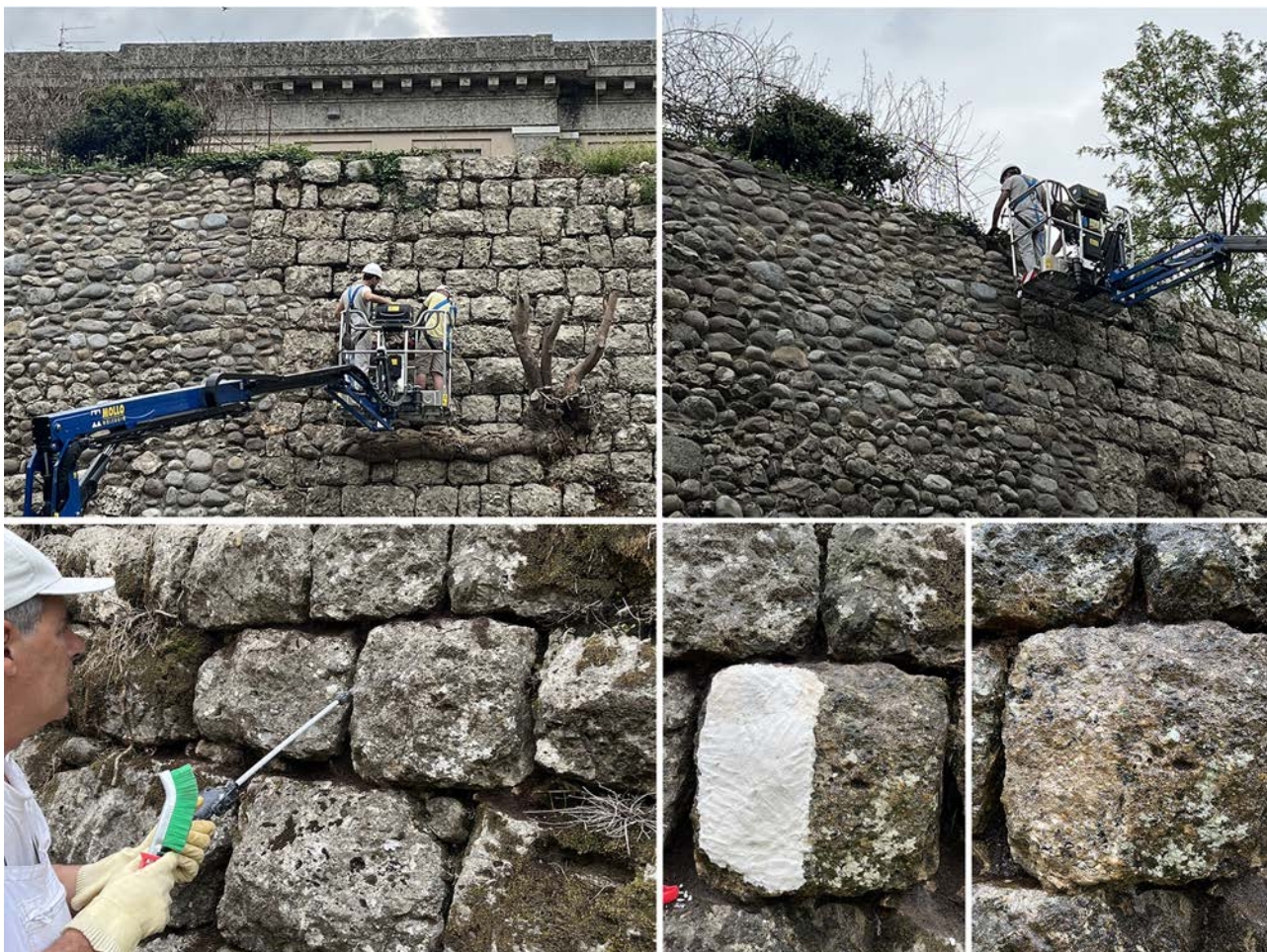
Fig. 5. Esempi di campionature eseguite nel cantiere pilota 2. In alto da sinistra: rimozione di ceppaie con sega circolare manuale; rimozione della vegetazione infestante sulle creste murarie mediante accetta. In basso: prove di pulitura della superficie lapidea in blocchi di conglomerato di Monte Orfano con (a sinistra) spray d'acqua nebulizzata e detergente neutro; con (a destra) impacchi di polpa di cellulosa imbevuta di biocida, e successiva rimozione dopo 48 ore.

Fra i metodi di pulitura sperimentati 19 , il più efficace si è rivelato l'idropulitura a pressione controllata fra le 30 e le 70 atmosfere, a seconda delle condizioni degli elementi lapidei della cortina. Esso ha restituito risultati apprezzabili, nonostante non abbia garantito l'asportazione completa dei licheni presenti sulla superficie, in particolare quelli più radicati.