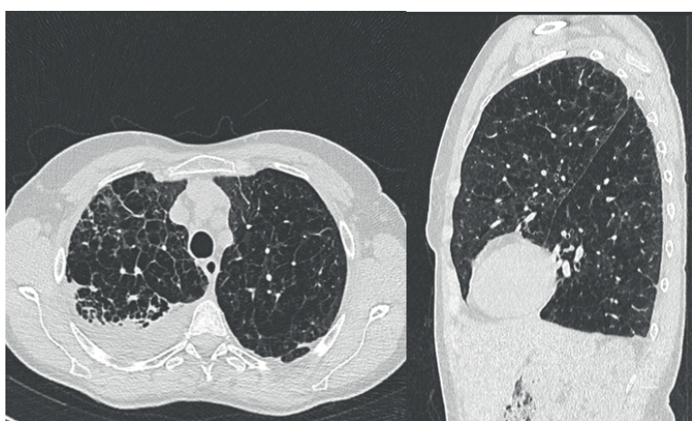
Figura 1 - Immagini TC del torace ad alta risoluzione con evidenza di quadro di pleuropolmonite e diffuso enfisema di tipo misto.

postare un adeguato percorso di presa in carico dei pazienti. Ciononostante, il DAAT rappresenta ancora oggi un fattore di rischio scarsamente considerato all'interno dei percorsi diagnostico-terapeutici. Il caso clinico di seguito è un esempio di come una diagnosi tempestiva di DAAT avrebbe potuto rallentare la progressione di enfisema e BPCO.